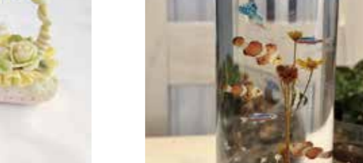
石けんの香りのするソープバスケット♪好きな色で作れます。夏休みの工作にどうですか?大人が付き添う場合は、別途昼食代700円必要です。