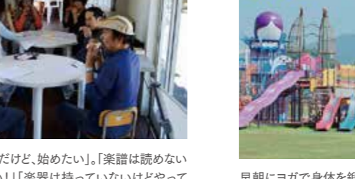
オカリナは初めてだけど、始めたい!。「楽譜は読めないけどやってみよう!」「楽器は持ってないけどやってみよう!」。そんな方は、この会でオカリナデビューをしてみませんか。楽器を持っていない方は、無料で会の楽器をお使いいただけます。