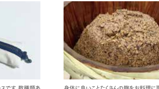
ペンが4〜5本入るスリムなペンケースです。数種類ある生地から表地と裏地を選んでオリジナルペンケースを作ります。