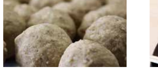
すぐにみそ汁が飲みたい!と思った時にパッとできちゃうのがみそ玉のいいところ。インスタントでは味わえない本物の味を手軽に。作ったみそ玉のお土産つき。子供と一緒にまるまるころころ!