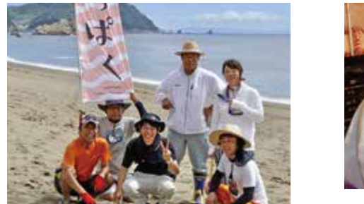
夏本番！高浜海岸を一緒に掃除しませんか。掃除終了後は、キレイになった海岸で自由に遊んでください♪