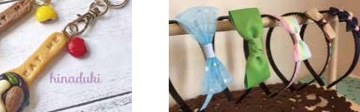
樹脂粘土のスプーンクッキーに焼き色を付け、好きなパーツをトッピングして自分だけのキーホルダーを作っちゃおう！とびこみOK!