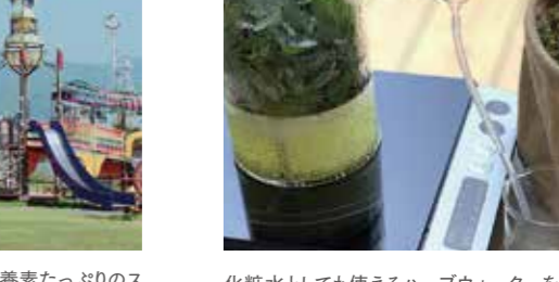
早朝にヨガで身体を鍛えて、植物栄養素たっぷりのスイーツで身体の中も美しく健康にできる内容にしています♪みんなで朝活しましょう!(ヨガマット、水分、タオル(汗拭き用)は各自ご用意ください)