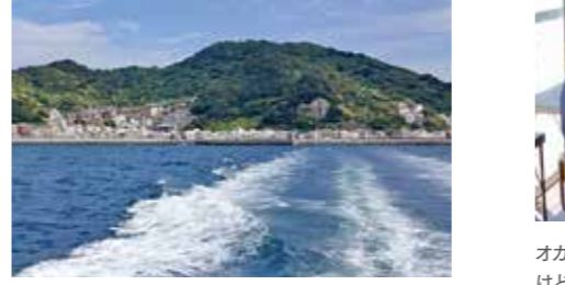
ついに登場!保戸島周遊クルージング!そして昼食は、島のおばあちゃん家で保戸島ひじきごはん&クロメ汁。早い者勝ちです。