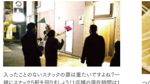
入ったことのないスナックの扉は重たいですよ?一緒にスナック5軒を回りましょう!1店舗の滞在時間は15分厳守!フンドリンクとおつまみとママのおしゃべりを楽しまえます。終わった後は気分に入ったスナックへGo!