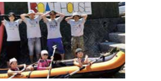
四浦半島の荒代海岸で2人乗りカヌーでリアス式海岸に乗り出す。初心者には優しくレクチャーします。海上でハーモニカおじさんが登場!