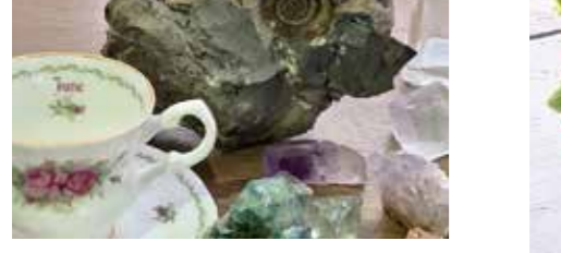
鉱物やアンモナイトの化石などを片手にゆっくりお茶をしませんか？網代島や石灰岩など津久見ならではの石も展示します。お気軽に石の持ち込み大歓迎！※ご予約は1時間単位でお受けします。