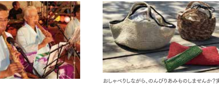
尺八の吹き方を習って簡単な曲を吹いてみましょう。初心者でも吹けるよう工夫しています。