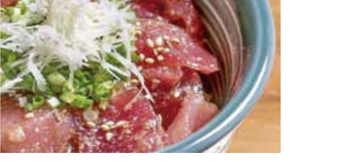
保戸島の迷路のような入り組んだ細い道(せど)を探検し、昼食には保戸島名物ひゅうが丼作り体験をして食べましょう!(歩きやすい服装、帽子など暑さ対策をお願いします。)