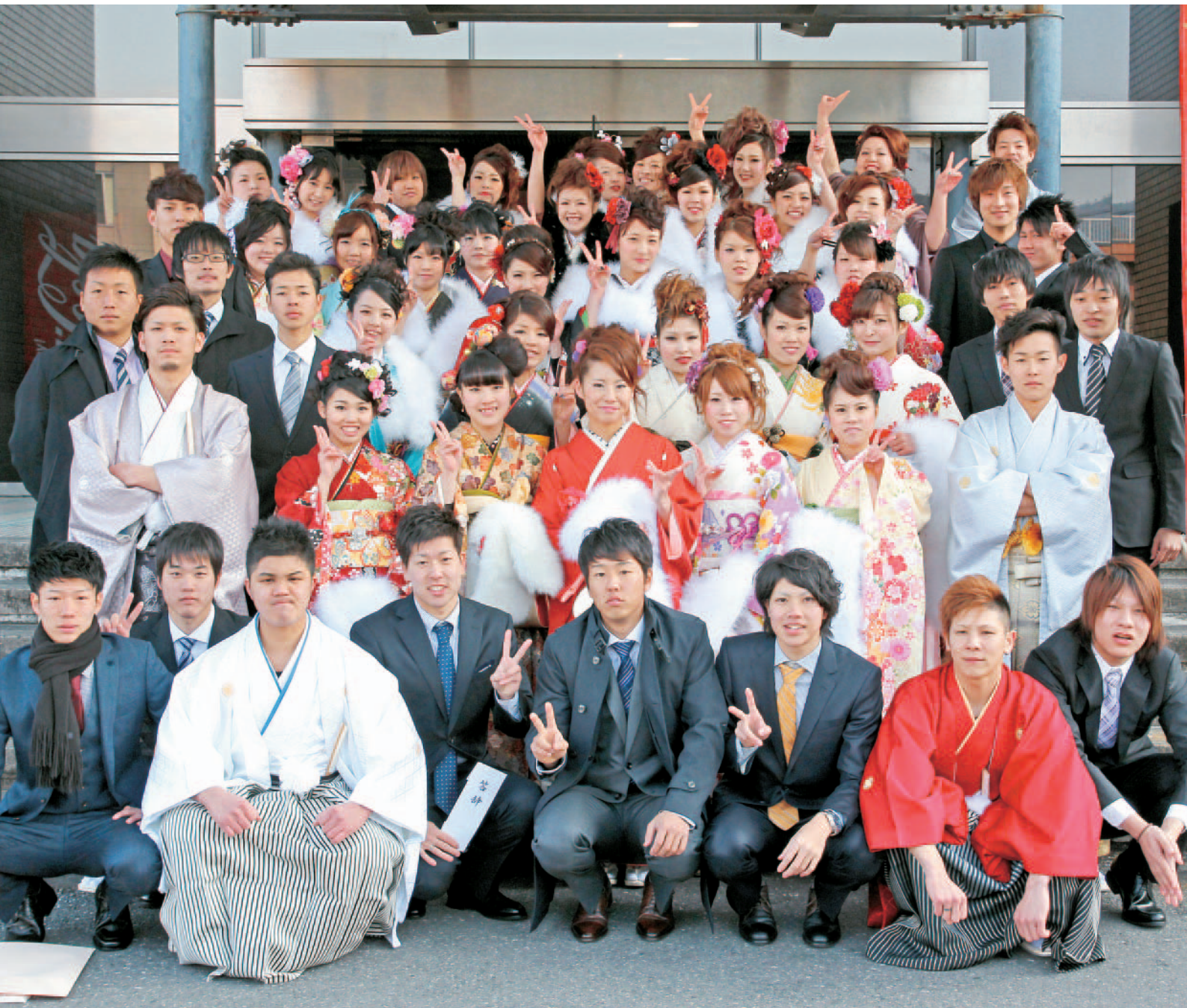
津久見市成人式 (1月12日 津久見市民会館)