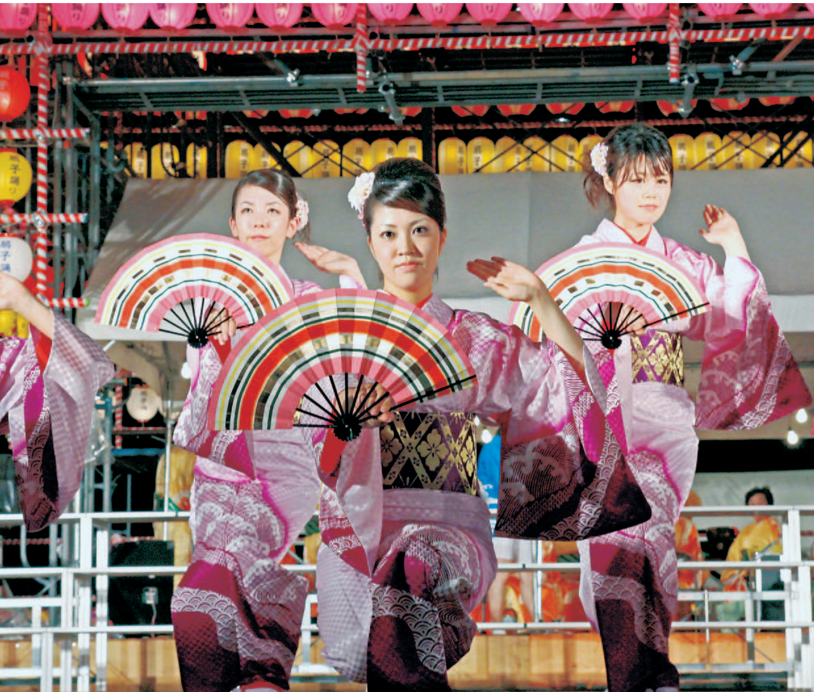
第50回 津久見扇子踊り大会 (8月24日 つくみん公園)