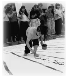
H25「つくみ港まつり」での書道パフォーマンス(写真中央)

これこそが、私に与えられた運命だと信じて頑張っていきたいです。そして、あの日見た、「耀いた」母の顔と同じように、周りの人を幸せな気持ちにしたいです。