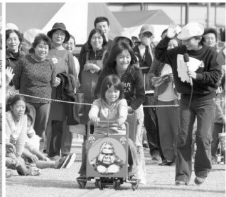
◎10月29日と30日の2日間、第23回津久見市ふるさと振興祭・第10回つくみ「生き粋き」フェアがつくみん公園で行われ、多くの来場者で賑わいました。