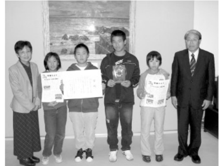
◎大分県学校新聞コンクールで久保泊小学校の「学校だより」が3年連続で入選しました。