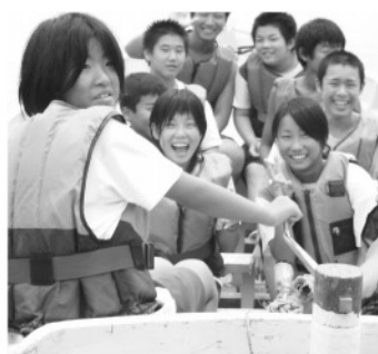
絆を強めた教育キャンプ

重畳緑の山々を背に、澄みきった豊かな海を抱いた日代中学校は、全校生徒23名。生徒数が少ない特性を生かしたきめ細かい学習指導をしています。