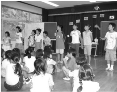
特認校体験入学会

越智小学校は、春と秋に「特認校体験入学会」を行っています。ふれあいゲームをしたり、地域の素材を生かした料理を作ったりしています。参加してください。方々からは、「自然の中で普段できない体験をすることができた」「地域の温かさを感じた」など、とても喜んでいただいています。越智の子どもたちにとっても、たくさんの人たちと交流ができて、いい刺激になっています。