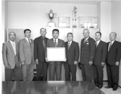
◎10月18日、大分県安全・安心まちづくり県民大会が大分市で行われ、四浦防犯パトロール隊が表彰されました。