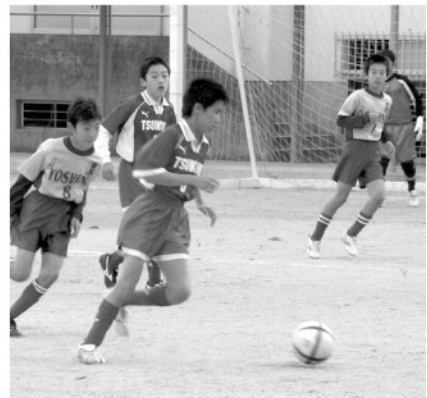
◎11月19日と20日の2日間、東九州都市間交流第36回サッカー津久見大会が津久見高校グラウンドなどで行われました。