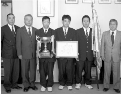
◎九州高校軟式野球大会で優勝した津久見高校軟式野球部が報告のため市役所を訪問しました。