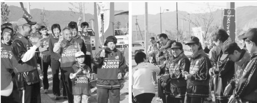
◎11月21日(日)、スペシャルオリンピックス(知的発達障害のある方の社会参加と自立を支援するもの)を一人でも多くの方に知っていただき、盛り上げていくためのトーチラン(聖火リレー)が市内で行われました。