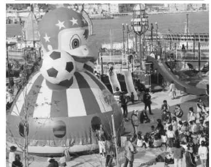
◎12月11日(土)、つくみ冬祭りがつくみん公園を中心に行われ、多くの人で賑わいました。