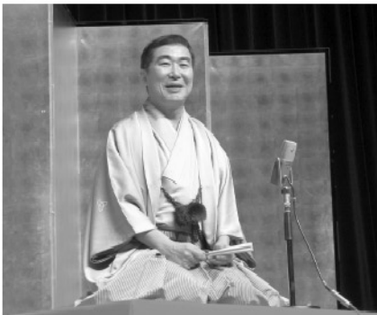
◎11月23日(火)、津久見観劇会主催による「桂三枝独演会」が市民会館で行われ、約450名が入場しました。