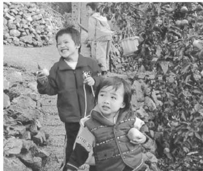
◎12月5日(日)、千怒のみかん園で、もぐもぐ体験ツアー(みかんの収穫体験)が行われ、市内外から多くの人が参加しました。