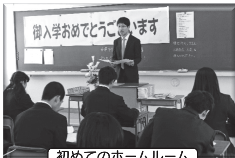
初めてのホームルーム