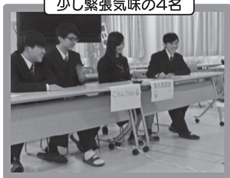
少し緊張気味の4名

平成30年3月19日(月)に本校普通科1・2年生4名と立命館アジア太平洋大学(APU)の留 学さん2名(ともにベトナム出身)と、テレビ会議システムを利用して交流を図りました。