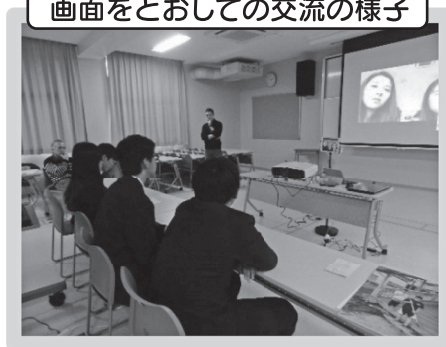
画面をとおしての交流の様子