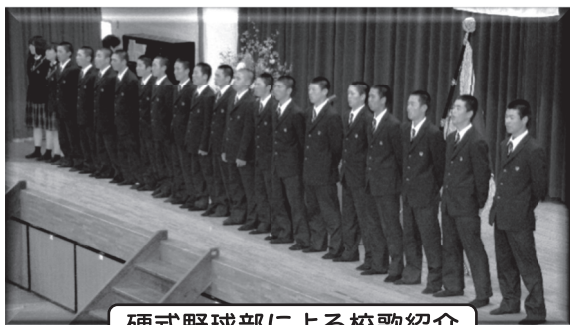
硬式野球部による校歌紹介

の3つの提言があり、将来、人生において、高校時代がとても輝いていたと言える ように高校生活を充実させてほしいと新入生へエールを送りました。