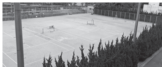
総合運動公園テニスコート

総合運動公園テニスコートは、昭和59年11月に完成し、これまで多くの方々に利用されてきましたが、施設の老朽化やコートの主流が人工芝へと移行している現状も踏まえ「スポーツ振興くじ(toto・BIG)助成金」を活用し全面改修工事を行います。主な改修内容は、4面のコートを砂入り人工芝生化スタンドの改修等も行います。なお、工期は平成30年3月末までとなっております。工事完了までコートの利用ができず、市民の方々にはご迷惑をおかけしますが、ご理解とご協力をお願いします。