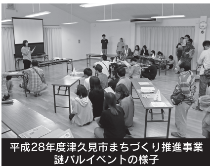
平成28年度津久見市まちづくり推進事業 謎バルイベントの様子

平成29年度台風第18号により、津久見市全域において甚大な被害を受けました。市中心部の各商店においても未だ災害の爪痕が残っています。そこで、津久見市商店街エリアに元気を取り戻し、賑わいの創出につながる等、復興まちづくりに寄与する事業を実施していただける団体および個人の募集を予定しています。