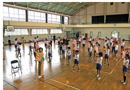
扇子踊り保存会の舞いに合わせて「扇子踊り」を舞う、津久見小学校6年生42名