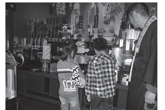
海徳寺住職の話聞いた後、「保戸島村国民学校戦災職員児童之霊」に手を合わせる子どもたち

期間 / 平成28年7月26日(火)～8月7日(日) 会場 / 津久見市民図書館 主催 / 津久見市・津久見市教育委員会 生涯学習課