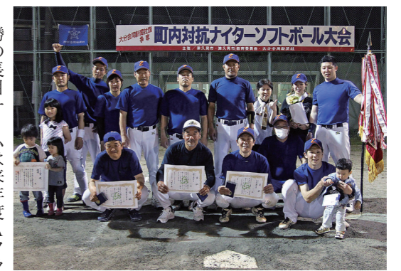
Aクラス優勝 千怒崎東チーム

6月6日、Aクラスの決勝戦が行われ、千怒崎東チームの6連覇達成で第42回大会が閉幕しました。 決勝は、初回から点を取り合う白熱した展開となりましたが、中盤以降、両投手の力強い投球が光り決勝戦となりました。最終回となった5回裏、1点を追う千怒崎東チームは逆転サヨナラ勝ちを収め、見事に6連覇を達成しました。 両チームは、津久見市代表として8月27・28日に大分市で開催される県大会に出場します。また、Bクラス優勝の旭中央チーム、準優勝の長目チームは来年度Aクラスでの出場となります。