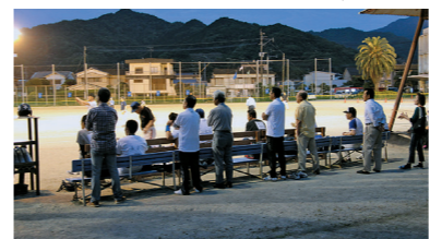
大勢の応援に盛り上がる試合

勝の長目チームは来年度Aクラスでの出場となります。 今大会から梅雨時期をさけ、開催時期を1ヶ月早めて大会を行いました。前回大会時の雨天中止が11日、今大会の雨天中止が4日と、開催時期変更の効果が少なからずあったので、今回はかきこえていた大会も5月中旬の開幕を予定しています。