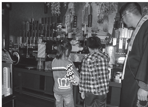
海徳寺住職の話聞いた後、「保戸島村国民学校戦災職員児童之霊」に手を合わせる子どもたち

期間 / 平成28年7月26日(火)～8月7日(日) 会場 / 津久見市民図書館 主催 / 津久見市・津久見市教育委員会 生涯学習課