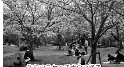
昨年のスケッチ大会の様子