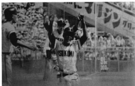
第54回 全国高等学校野球選手権大会優勝 (昭和47年)

音源：第54回大会(昭和47年)決勝戦 津久見高校 VS 柳井高校 および その際の本校校歌