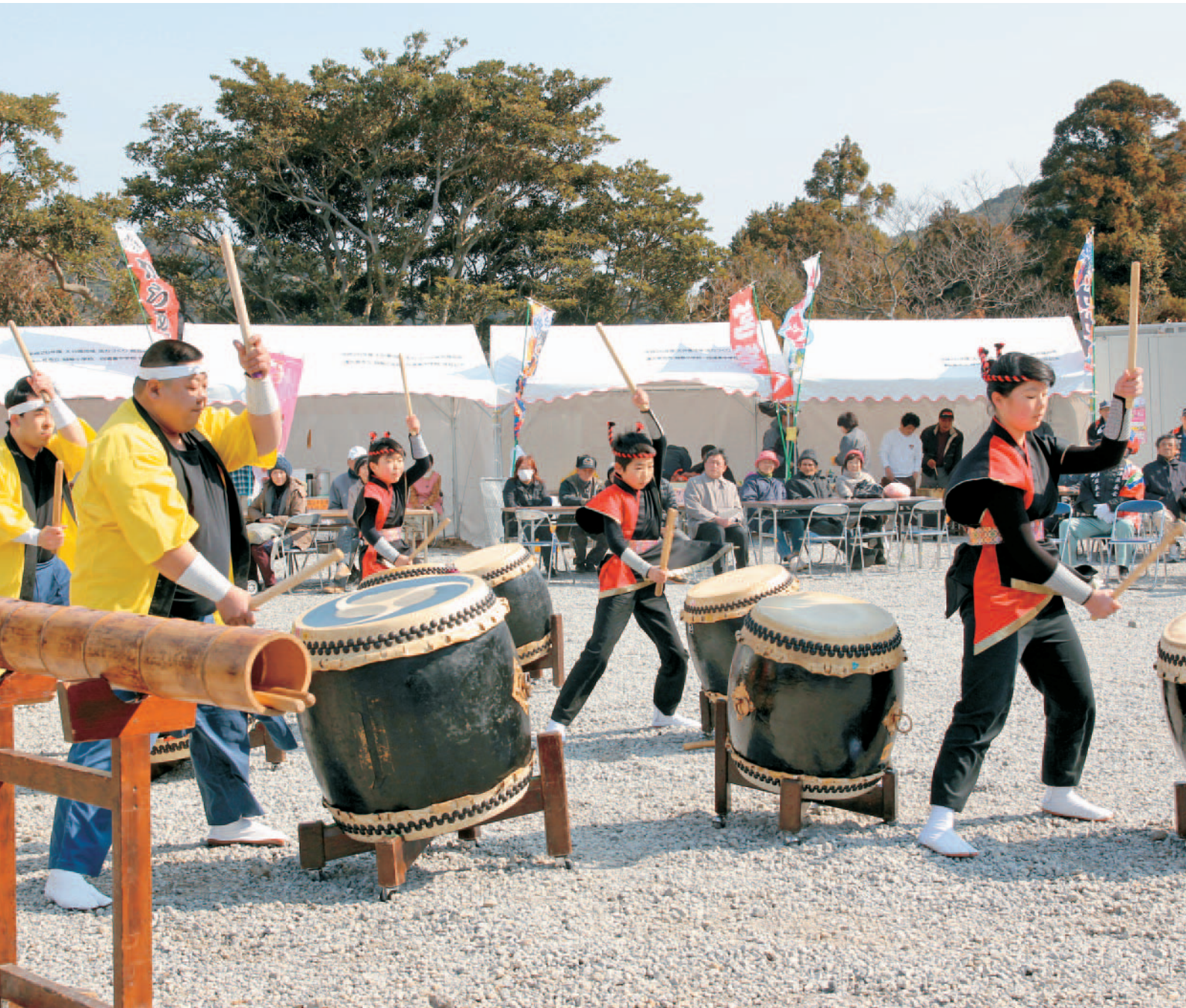
第3回 豊後水道河津桜まつり (2月15日～3月1日 四浦 蔵谷)