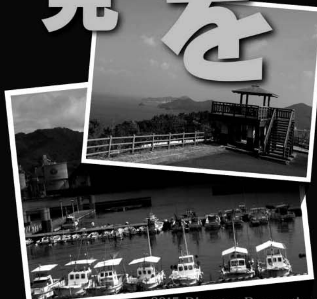
2015 Disaster Prevention Symposium in Tsukumi