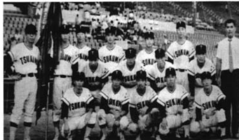
全国高等学校野球選手権大会 (昭和47年)