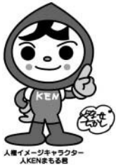
人権イメージキャラクター KEN まもる君

欠かせないものになっていきます。かつてのコンピュータは関連する組織のコンピュータとだけで接続し、情報交換が行われていたのですが、世界中の研究者や技術者が、電子メールや電子会議で意見を出しながらずつインターネットの仕組みを作り上げました。壮大なボランティアがつくったものなので自由を基本にしています。インターネットは世界中のコンピュータとつながっているのです。大勢の人が自由に国境を越えることができます。社会的な不公平・不合理や不当な政治に対する批判もできるよ