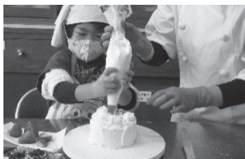
年末親子ケーキ作り(12月)