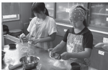
夏休み親子パン教室(8月)