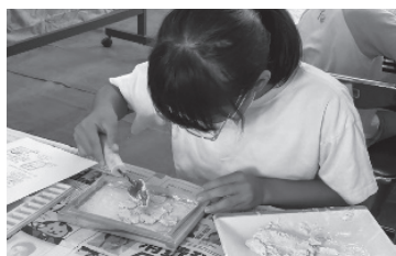
フレスコ画教室(7月)