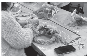
年末しめ飾り作り(12月)