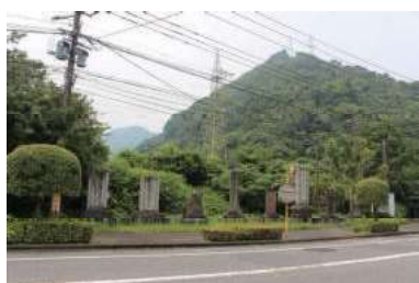
戸高倉太翁之碑 平山衛十郎翁之碑 小手川化平翁頌徳碑 小手川長十郎翁彰徳碑 小手川吉夫翁頌徳碑 道路記念碑 (千怒)