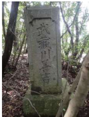
武蔵川善吉 (之塔) (落ノ浦)