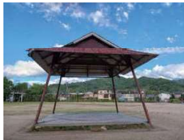
市営グラウンドに残る 赤八幡神社の土俵 (宮本町)