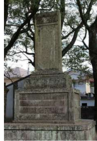
柑橘記念碑 (宮本町)