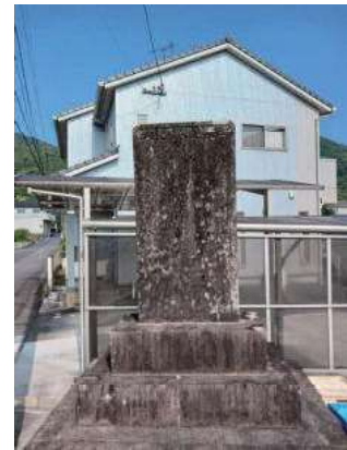
改道功労碑 (彦ノ内)