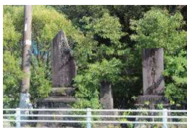
濱嵐半次郎之塔 音頭 麻生富五郎碑 大和船改造元祖麻生紋吉記念碑 (津久見浦福)