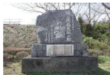
源兵衛翁生誕之地（千怒）