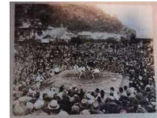
赤八幡神社の土俵と 相撲大会の様子 (年代不明)