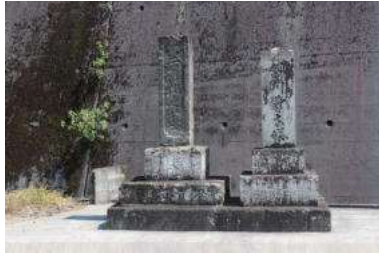
若花之墓 錦川豊吉塔 (大友町)