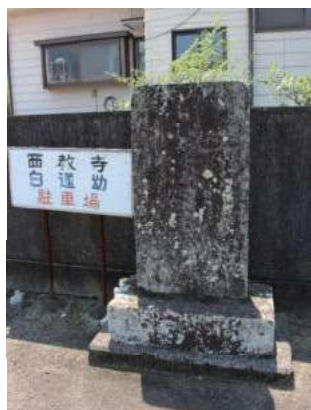
道路改修碑（大友町）