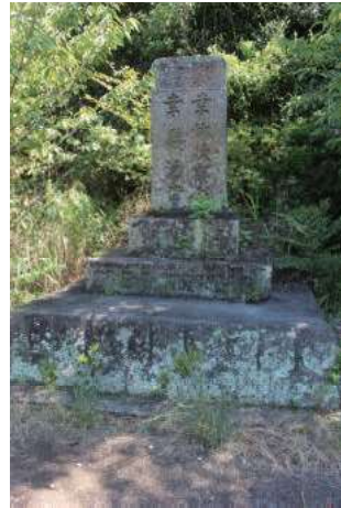
彰徳碑 幸休次郎翁幸幾治君 (久保泊)