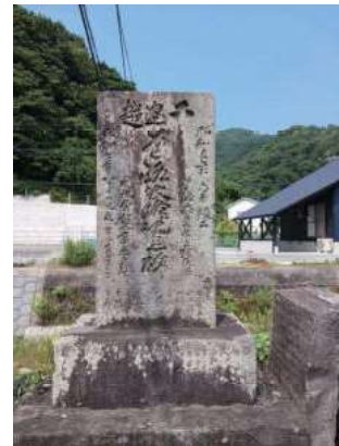
千怒越道路改修記念碑