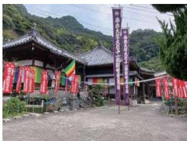
観音様祭り（落ノ浦・本教寺）