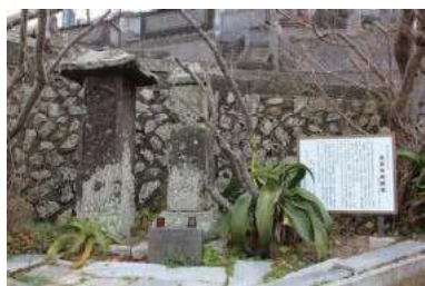
海徳寺の魚鱗塔及び海徳寺石幢 （保戸島）

豊かな海、豊後水道は、津久見湾岸域で暮らす人々の生活を支えてきた。浦々にはそうした人たちの暮らしや豊漁祈願や航海や海上での安全等を願う信仰の歴史を伝える文化財等が数多く残っている。