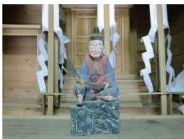
狩床愛宕神社のえびす像