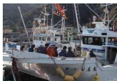
深良津十日えびす