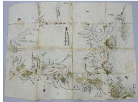
鳩浦・落野浦・久保泊・深良津四浦 分絵図