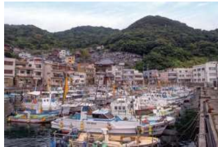
未来に残したい漁業漁村の 歴史文化財産百選