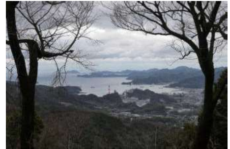
畑地区の山頂に建つ 金毘羅様から津久見湾を望む