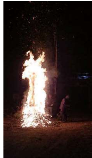
夜渡の火焚き（久保泊）