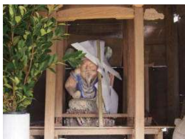
落ノ浦のえびす像