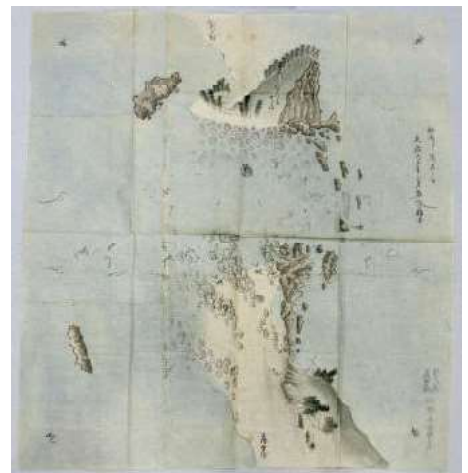
上浦村組落野浦・保戸嶋間絵図 「船通り二障儿石之分文政六未年 三月口候絵図」