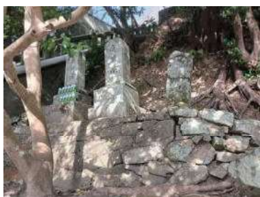
加茂神社庚申塔群（保戸島）