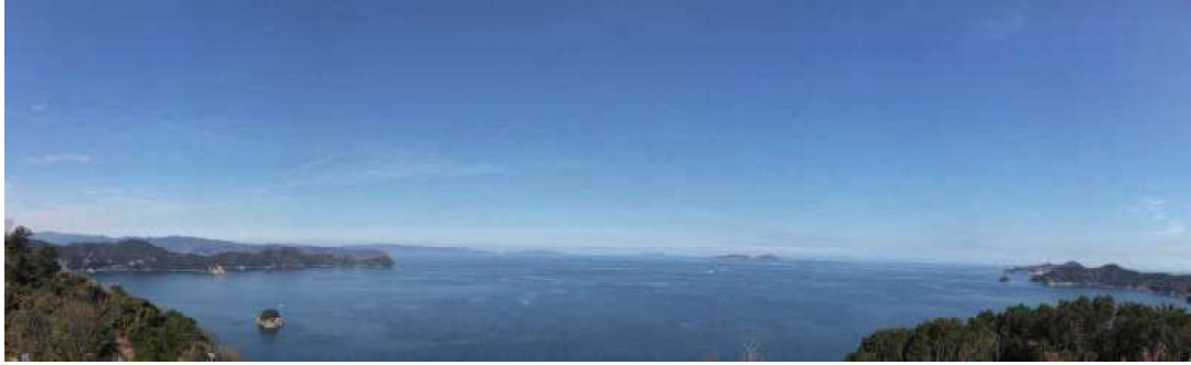
四浦展望台から望む豊後水道