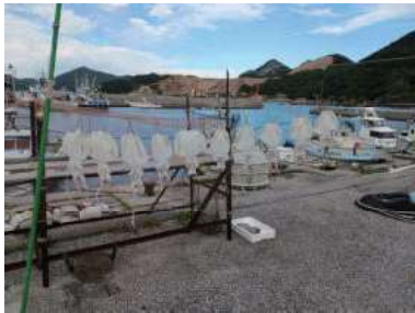
四浦半島漁村の風景 イカの一夜干し