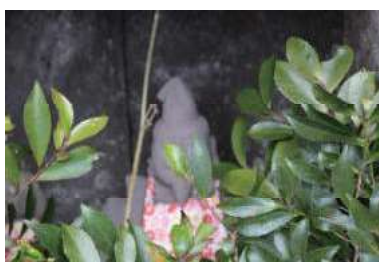
保戸島地下のえびす像