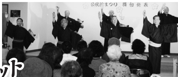
男性舞踊教室(公民館まつり舞台発表)