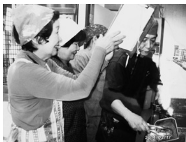
野菜もりもりクッキング (中津からあげ体験学習)