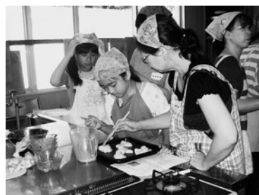
(親子)パンつくり教室