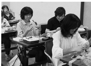
パッチワーク教室