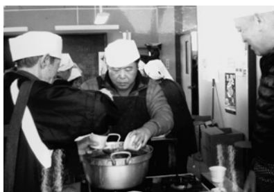
男の楽しくクッキング (公民館まつりカレー)