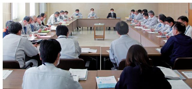
↑津久見市新型コロナウイルス感染症対策本部の様子

市長を本部長とし、各課長で構成する対策本部会議を開催し、全庁的な情報共有と感染拡大防止に向けた取り組みを進めています。