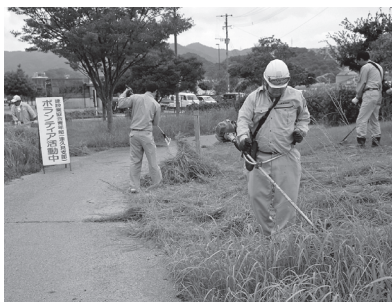
大分県建設業協会青年部会津久見支部