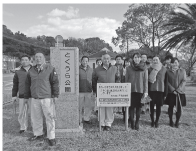
株式会社戸高鉱業社