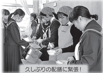
久しぶりの配膳に緊張!

「つくみ蔵」の店舗運営に取り組む商業調査部が、地元の食材を使い、小中学生に喜んで食べてもらえる「ヘルシー給食メニュー」の提案をし、1月24日(金)の給食交流会で津久見市内の小中学生に披露しました。提案したメニューは、「つくみまぐろのヘルシー丼」と「ようらひじきのヘルシースープ」です。当日は、第一中学校の1年生3クラスにお伺いし、配膳の手伝いを行った後、メニューの説明をし、中学生と一緒に給食をいただきました。最後にアンケートに感想を記入してもらい、交流会を終りました。参加した生徒は、訪問する前「おいしい」と言ってもらえるのが不安を抱いていましたが、おいしそうに食べている中学生の姿にほっとした様子でした。メニュー開発にあたって、第一中学校や給食センターの方々には大変お世話になりました。今回提案したメニューが、今後、定番メニューになることを期待しています。