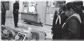
作品展示物を見る中学生(上図) 電動スクーターの実演(下図)