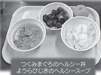
つくみまぐろのヘルシー丼 ようらひじきのヘルシースープ