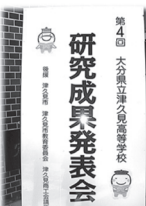
第4回 大分県立津久見高等学校 研究成果発表会

1月28日に第4回生徒研究成果発表会を行いました。当日は、市内中学2年生や保護者、地域の方のご参加をいただき、各学科で1年間取り組んできた研究、調査内容について発表をしました。今後も地域の方に、少しでも津久見高校のことを知っていただく機会にするために会の充実を行っていきたく考えています。