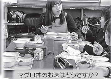
マクロ丼のお味はどうか?