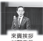
来賓挨拶 川野市長