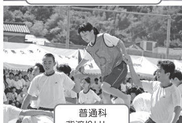
普通科 背渡りリレー