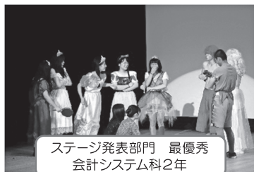
ステージ発表部門 最優秀 会計システム科2年

最大の行事である津高祭が10月2日(水)～4日(金)に行われました。「RAISE THE SMILE ～笑顔を掲げろ～」をテーマに、初日の市民会館でのステージ発表、二日目の校内での展示・バザー、最終日の体育大会と生徒の笑顔に満ちた3日間となりました。体育大会では、体育授業の成果発表として1・2年合同で、男子が集団行動、女子が扇子踊りを披露しました。特に扇子踊りは、本年度、浴衣を着用しました。浴衣を着用した踊りはとても優雅で晴れやかでした。踊りの指導をいただいた扇子踊り保存会および当日浴衣の着付けのお手伝いをしていただいた保護者、地域の皆様のご協力のおかげです。大変お世話になりました。