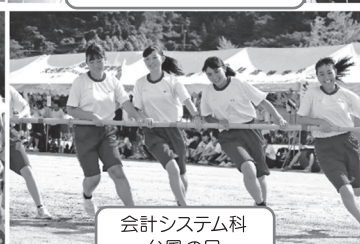
会計システム科 台風の日