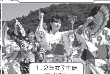
1、2年女子生徒 扇子踊り