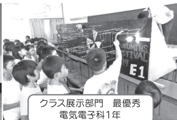
クラス展示部門 最優秀 電気電子科1年