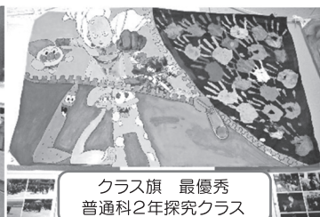
クラス旗 最優秀 普通科2年探究クラス