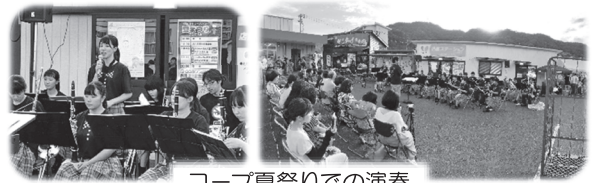
コープ夏祭りでの演奏