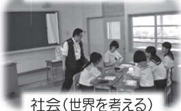
社会(世界を考える)