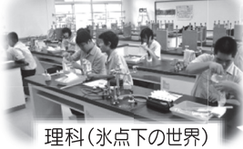
理科(氷点下の世界)