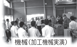
機械(加工機械実演)