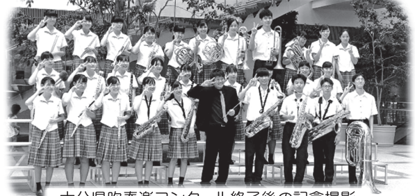
大分県吹奏楽コンクール終了後の記念撮影

7月6日のコープ夏祭りに吹奏楽部がオープニング演奏を行いました。夏の夕暮れの一瞬、会場には多くの方が訪れ、演奏に耳を傾けてくれました。