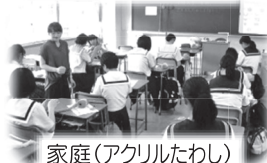
家庭(アクリルたわし)