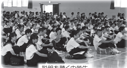
説明を聴く中学生