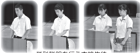
学科説明を行う本校生徒