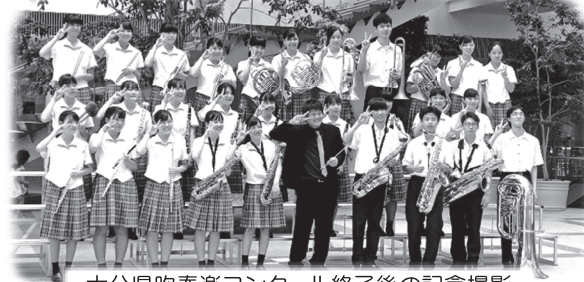
大分県吹奏楽コンクール終了後の記念撮影

7月6日のコープ夏祭りに吹奏楽部がオープニング演奏を行いました。夏の夕暮れの一瞬、会場には多くの方が訪れ、演奏に耳を傾けてくれました。