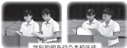
学科説明を行う本校生徒

8月7日(水)に体験入学会を実施しました。台風8号の接近にともない開催も心配されましたが、当日は天候も回復し、中学3年生、保護者、引率者を合わせて330名の参加がありました。全体説明では、プレゼンテーションソフトを使い本校生徒が学校全体説明、各学科説明を行いました。その後、事前の希望調査にもとづいて一人2講座の体験を行いました。今回の体験入学会を参考にし多くの中学生が津久見高校を志願してくれることを期待しています。