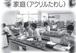
理科(氷点下の世界)