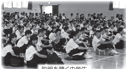
説明を聴く中学生