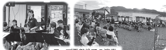
コープ夏祭りでの演奏