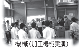
機械(加工機械実演)