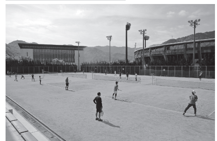
▼昨年の大会の様子