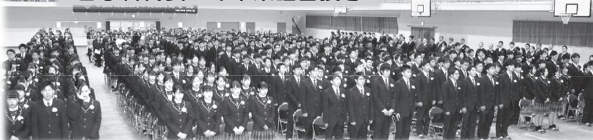
津高卒業生の新しいステージでの活躍に熱いYELL(エール)をお願いします!