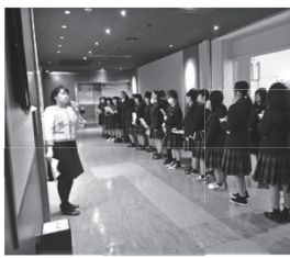
サッポロビール工場 見学の様子