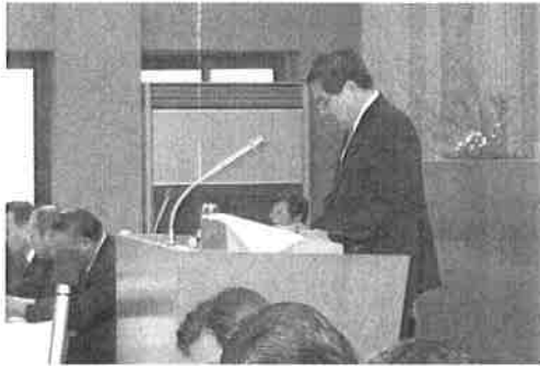
質問する知念議員