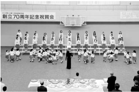
榎の実少女少女合唱団の澄んだ歌声