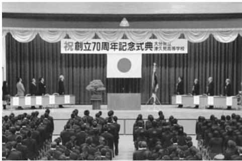
多くの来賓を迎えての式典

10月10日(土)に、津久見高校創立70周年記念の式典・講演・祝賀会が開催されました。