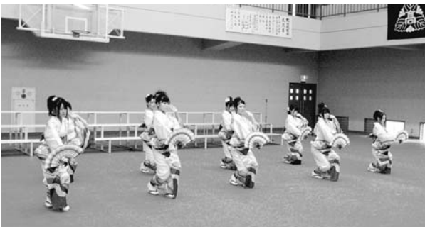
祝賀会に華を添えた扇子踊り

10月10日(土)に、津久見高校創立70周年記念の式典・講演・祝賀会が開催されました。