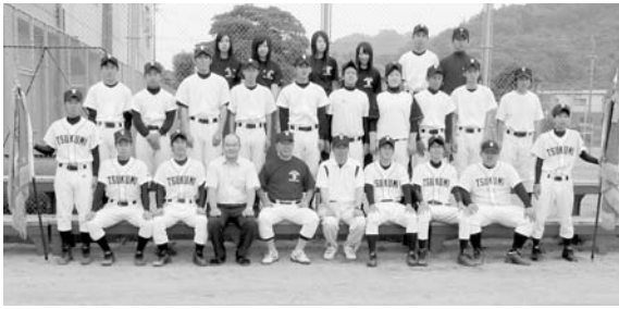
二連覇を達成した軟式野球部 勝ち取った優勝旗が光ります

5月30日から6月1日まで3日間にわたって大分県高等学校総合体育大会が行われました。上位に入賞した部・個人は左の表をご覧ください。二連覇を達成した軟式野球