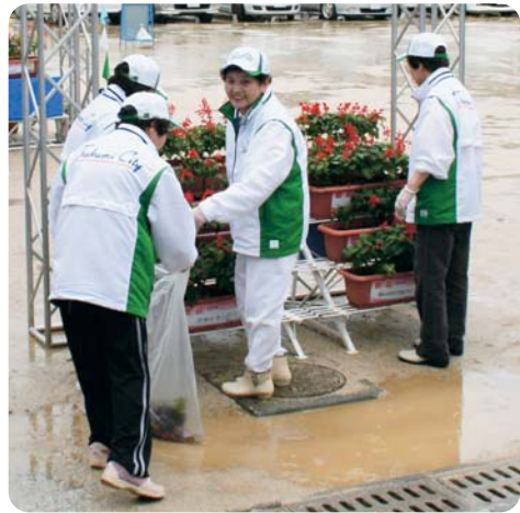
花いっぱいのもちでおもてなしを—— 雨粒の落ちるなかでも、会場の花壇を手入れしてくれたボランティアのみなさん。

ボクシング競技会をご観戦の常陸宮同妃両殿下。繰り広げられる熱戦に、惜しみない拍手を送っております。