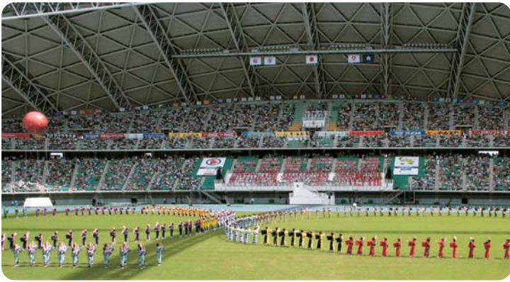
総合開会式では、満員の観衆に扇子踊りを披露。ひと時の雅やかな舞——会場は大きな拍手に包まれました。